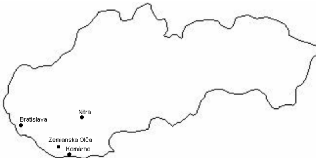
Mapa 1: Poloha obce Zemianska Olča na Slovensku vo vzťahu k hlavnému mestu, krajskému centru a okresnému mestu